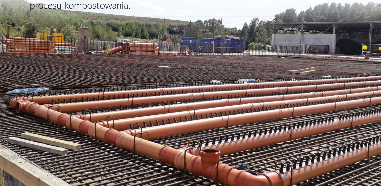
Biofiltr – montaż rur napowietrzających

Oczyszczenie emitowanego powietrza procesowego oraz hermetyzacja obiektu – to główne założenia inwestycji realizowanej przez Zakład Utylizacyjny w Gdańsku. Jej celem jest ograniczenie emisji substancji odorowych, będących następstwem procesu kompostowania.