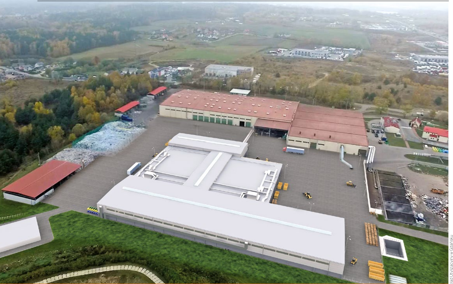
Zakład Utylizacyjny w Gdańsku

włady rewizyjne oraz instalację zraszczającą utrzymującą odpowiednią wilgotność złoża. Odcieki powstałe w biofiltrze odprowadzone zostaną do zbiornika na odcieki. Obciążenie maksymalne 1 m 2 materiału filtrującego nie będzie większe niż 110 m 3 powietrza poprocesowego na godzinę. Na efektywność oczyszczania powietrza procesowego w biofiltrze szczególnie wpływ mają odpowiedni dobór materiału filtrującego oraz odpowiednio duża powierzchnia czynna złoża filtrującego, dostępna do zasiedlenia przez mikroorganizmy utleniające siarkę. W tym celu stosuje się porowaty materiał, taki jak: gleba, torf, kompost, trociny i zrębki drzewne, ułożony odpowiednio w warstwy, by umożliwić maksymalną penetrację złoża powietrzem. Proces filtracji wymaga kontroli parametru temperatury i wilgotności w celu utrzymania najlepszych warunków bytowania dla wspomnianych mikroorganizmów. Zastosowane w biofiltrze wypełnienie będzie charakteryzować się wysoką porowatością, dużą pojemnością wodną oraz długim czasem pracy (czas między wymianami złoża).